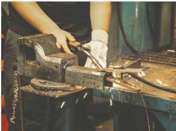
Metalværkstedet Korsør ProduktionsHøjskole

Derudover betyder det ikke nødvendigvis noget – værkstedsarbejdet er fortsat omdrejningspunktet i produktionsskoleforløbet, og det er fortsat baseret på praktisk arbejde og produktion.